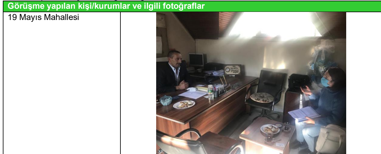
Tablo 3. Yapılan Görüşmeler ve ilgili Fotoğraflar

Görüşme yapılan bazı muhtar, STK ve kurumların listesi ve ilgili fotoğraflar aşağıdaki tabloda sunulmuştur.