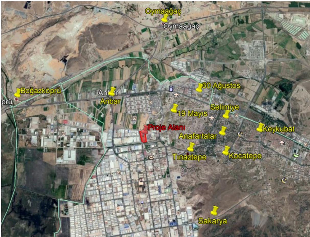
Şekil 2. Yakın Yerleşim Yerlerinin Proje Alanını göre Konumları