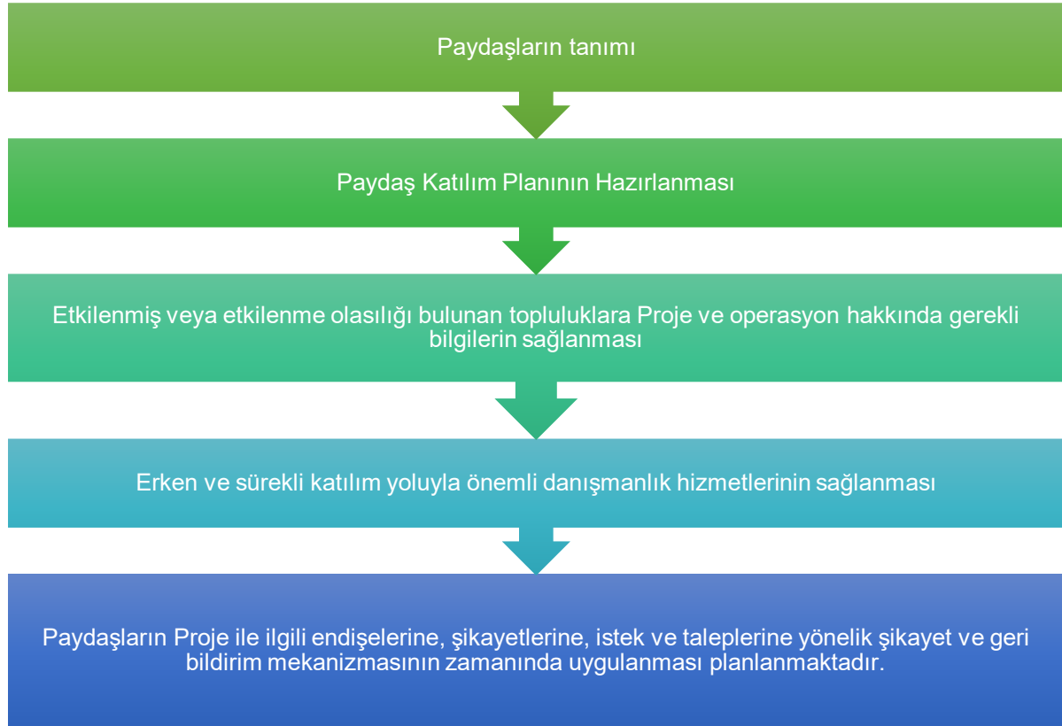
Şekil 3. Paydaş Katılımına İlişkin Uluslararası Standartların ve Yönergelerin Ana Gereklilikleri